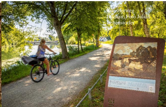
Künstlerweg Dachau