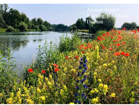
Ammer-Amper Radweg